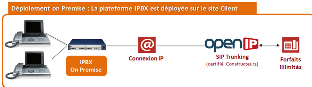
Schéma de déploiement